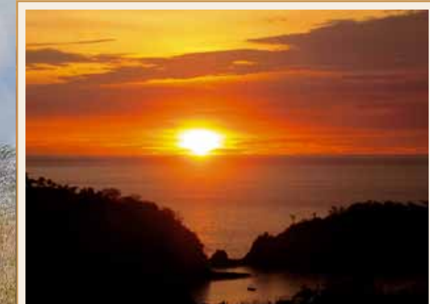
Atardeceres tan magníficos y multicolores como este son parte de los atractivos naturales que disfrutan diariamente quienes se hospedan en Lomas del Atardecer .